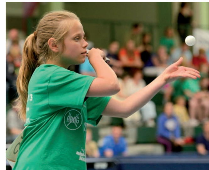
Volle Konzentration beim Aufschlag

Kontinuierliches Training in einem Verein ist wichtig, wenn Tischtennis richtig erlernt werden soll. Es gibt zahlreiche Spiel- und Übungsformen, die viel Spaß machen. Im Verein erhält man qualifizierte Trainingseinheiten, um mit anderen Kindern spielerisch die verschiedenen Techniken einzuüben.